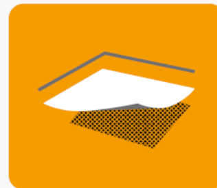
Strop nad nieogrzewaną piwnicą, podłoga na gruncie