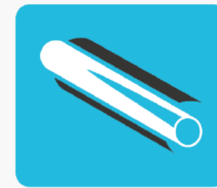
Centralne ogrzewanie i ciepła woda użytkowa