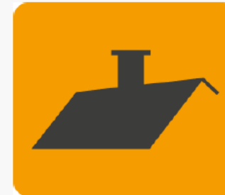
Dach lub strop