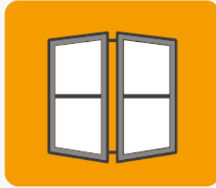
Stolarka okienna i drzwiowa