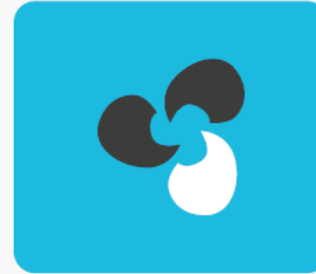
Wentylacja mechaniczna z odzyskiem ciepła