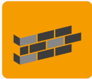
Ściany zewnętrzne oraz wewnętrzne, oddzielające pomieszczenia ogrzewane od nieogrzewanych