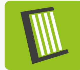
OZE: mikroinstalacje fotowoltaiczne i kolektory słoneczne